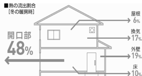
出典: (社)日本建材産業協会 省エネルギー建材普及センター 「21世紀の住宅には、開口部の断熱を...」より、平成4年省エネ基準で建てた住宅モデルにおける例